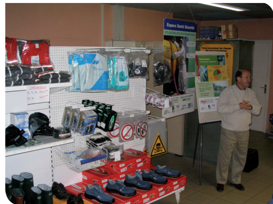
Des espaces Santé - Sécurité chez les distributeurs